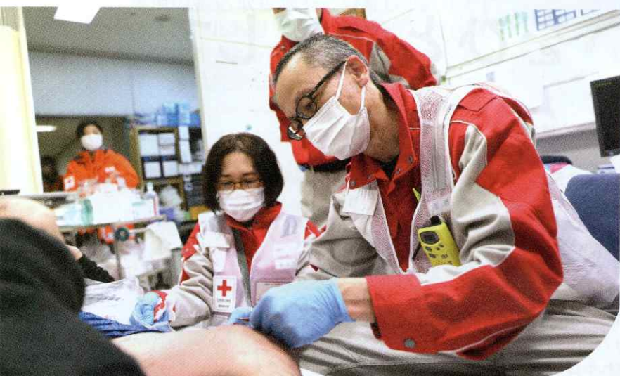
令和6年能登半島地震における救護活動の様子