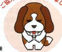
日本赤十字社北海道支部 マスコットキャラクター 「アンリー」