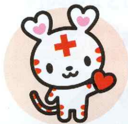
日本赤十字社公式キャラクター 「ハートちゃん」

日本赤十字社は、災害救護活動などを行う民間の法人です。 その活動は、国や地方自治体からの補助金ではなく、