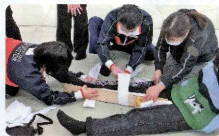
救急法の講習の様子(救急法救急員養成講習)